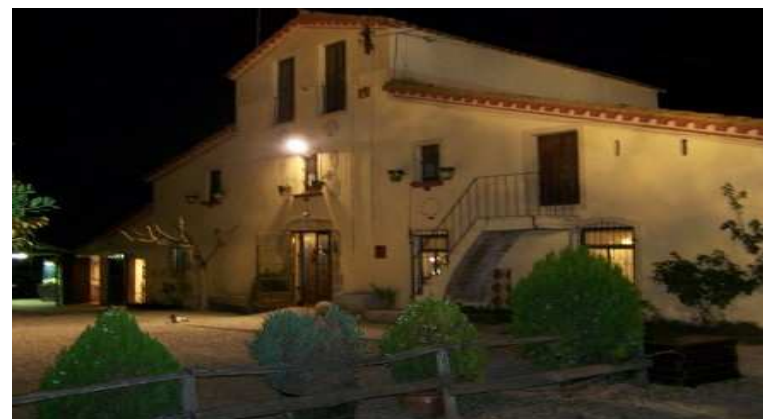
MASIA CAN GISPERT